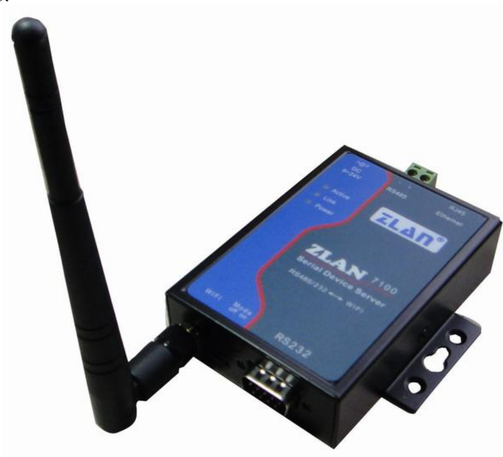
图 1 ZLAN7100 串口服务器

ZLAN7100 是一款高性价比的 WIFI 串口服务器，RS232 接口支持全双工、不间断通信；RS485 内嵌 485 防雷保护；支持虚拟串口，原有串口 PC 端软件无需修改。