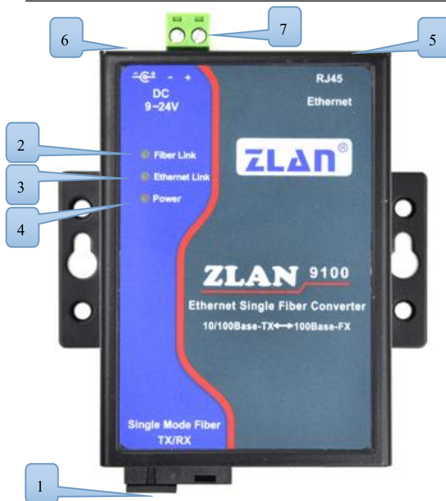
图 3 ZLAN9100 接口