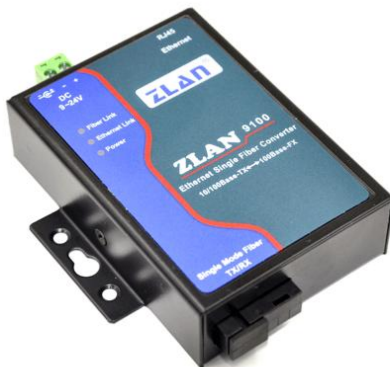
图 1 ZLAN9100 正视图

ZLAN9100 光纤收发器是一种将 10M/100M 以太网电信号转换成光信号或光信号转换成 10M/100M 以太网信号的光电转换设备，通过将电信号转换成光信号在单模光纤上传输，突破了电缆距离短的限制，使得以太网在保证高带宽传输的前提下，利用光纤介质实现几公里到几百公里的远距离传输。